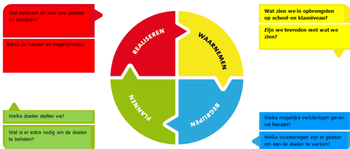
Figuur 1: de cyclus op OGW binnen De Bongerd

Hierop is "Handreiking; Hoe gaat De Bongerd om met haar opbrengsten?" tot stand gekomen, welke dient als praktisch hulpmiddel die richting dient te geven aan de wijze waarop wij als school omgaan met onze opbrengsten op klas- en schoolniveau.