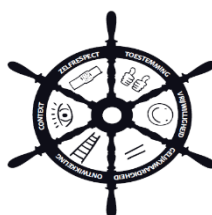
Figuur 2: De zes criteria seksueel gedrag

De lessen doorlopen de zes criteria om seksuele gedragingen en activiteiten te classificeren. Het stuurwiel (figuur 2) symboliseert de vergroting van autonomie en verantwoordelijkheid van kinderen.